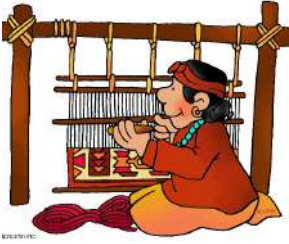
ཐགས་འཐག་པ།