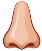
ན་བ་གཡས་གཡོན་གཉིས། ལྷ་ལུང་།