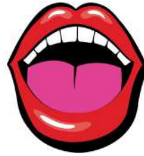
སོ་དང་ལྗེ་གཉིས།